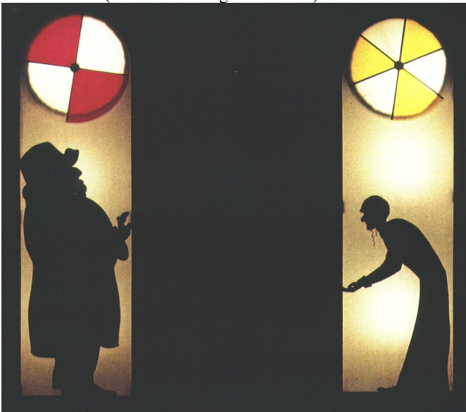
Wassilij Kandinsky: Samuel Goldenberg und Schmuyle © VG Bild-Kunst, Bonn 1995 mit freundlicher Genehmigung

Die Schüler deuteten die Ansicht Kandinskys von dem Klavierstück folgendermaßen: Zwei Gestalten (Goldenberg: aufgerichtet, stolz; Schmuyle: dünn, gebeugt) treten sich gegenüber. Sie handeln nicht in einem konventionellen Sinne, sondern vermitteln in ihren Haltungen und Gesten allgemeine Vorstellungen, die wir wieder aufgrund unserer Wahrnehmung und Erfahrung interpretieren: Es entsteht keine kommunikative Beziehung. Beide Figuren bleiben als Schattenrisse in ihren »Gehäusen« gefangen, getrennt durch eine unüberwindliche schwarze Fläche. Die beiden Kreise symbolisieren zusätzlich die Gegensätzlichkeit. Es entsteht eine Mischung aus Zeitprogression und -stillstand. Die Schüler meinten in der Mehrzahl, daß